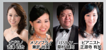
グループ・ヴィーヴ