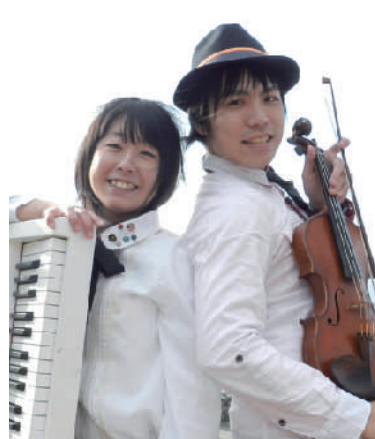
特別ゲスト: 第1回 聴衆賞 受賞 ORANGE