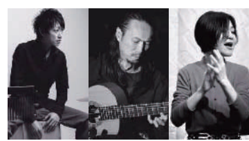
ゲスト: Universal Flamenco Orchestra