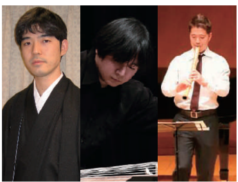
(一般部門)審査員特別賞 受賞 Free Style