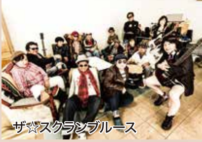
ザ☆スクランブルース