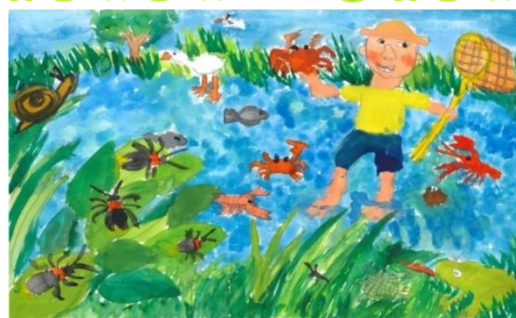
小学生の部 健軍文化ホール賞作品