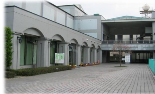
健軍文化ホール 正面入口