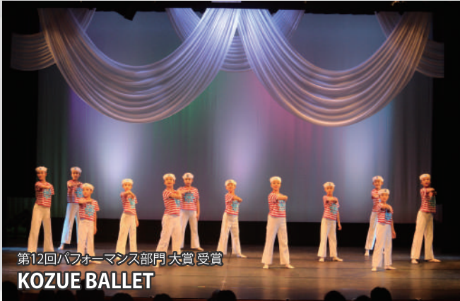
第12回パフォーマンス部門 大賞受賞 KOZUE BALLET