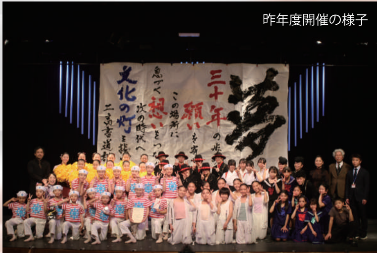
昨年度開催の様子

プロ・アマ・学生問いません! アーティストのあなた この機会お見逃しなく!! ご応募お待ちしております!!