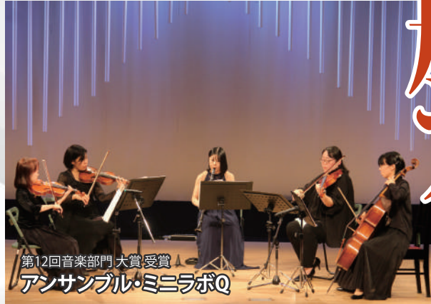
第12回音楽部門 大賞受賞 アンサンブル・ミニラボQ